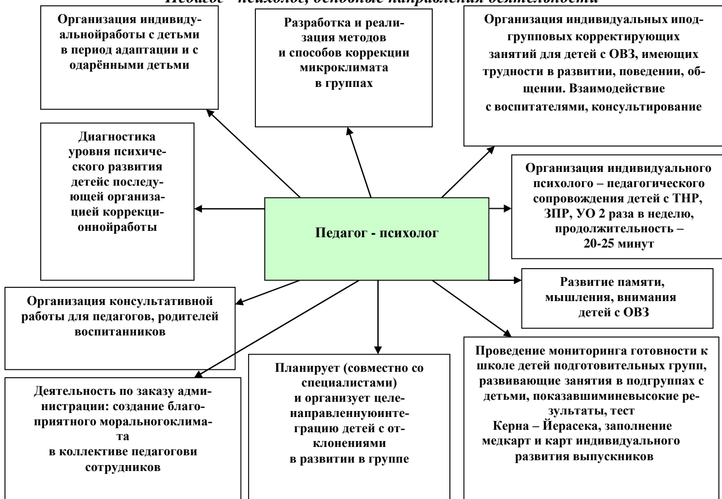
Рис. 2 «Педагог - психолог, основные направления деятельности»